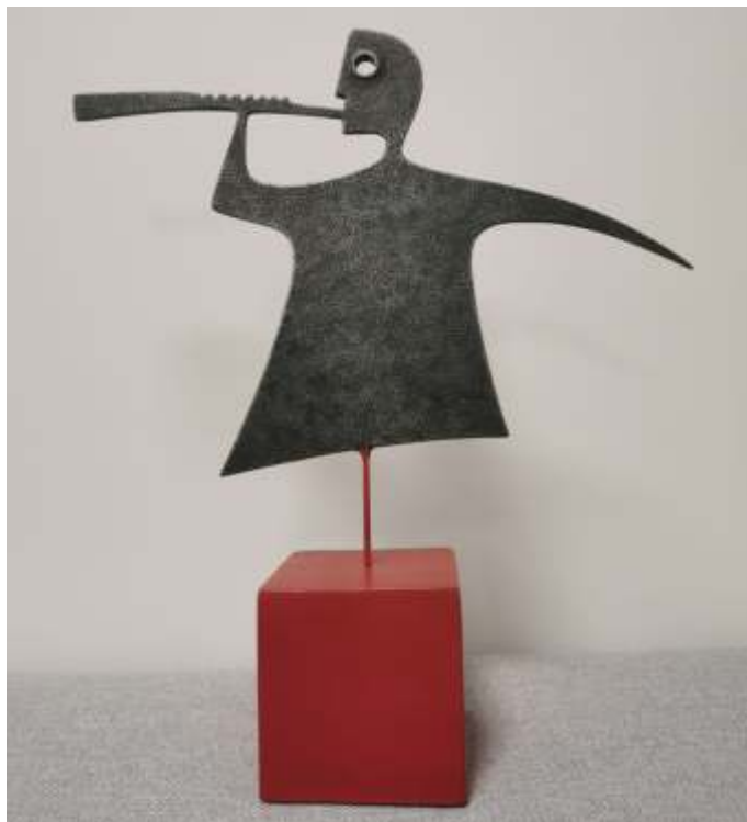
19. Signovaná železná socha Trubař od sochaře Ondřeje Svobody